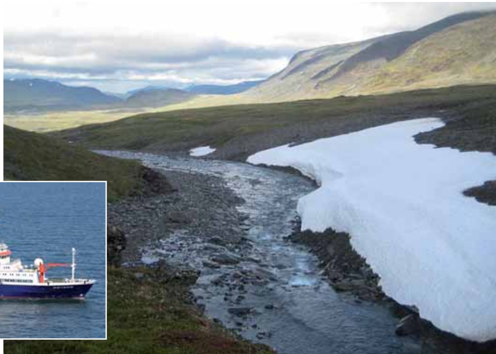
Aufnahme aus dem Einzugsgebiet des Kalix (Nordschweden) im Juli 2010. Kleines Bild: Forschungsschiff METEOR.